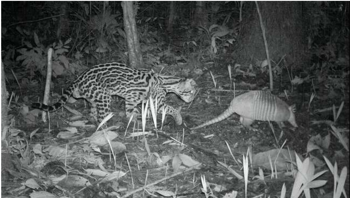
Op dit plaatje jaagt de ocelot op een gordeldier

Er zijn opnames gemaakt met cameravallen waarbij jaguars, ocelotten doden. Dat is waarschijnlijk vooral omdat de jaguar en de ocelot, voedsel concurrenten van elkaar zijn.